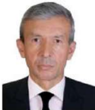
U.S. Kasimov Katta o'qituvchi